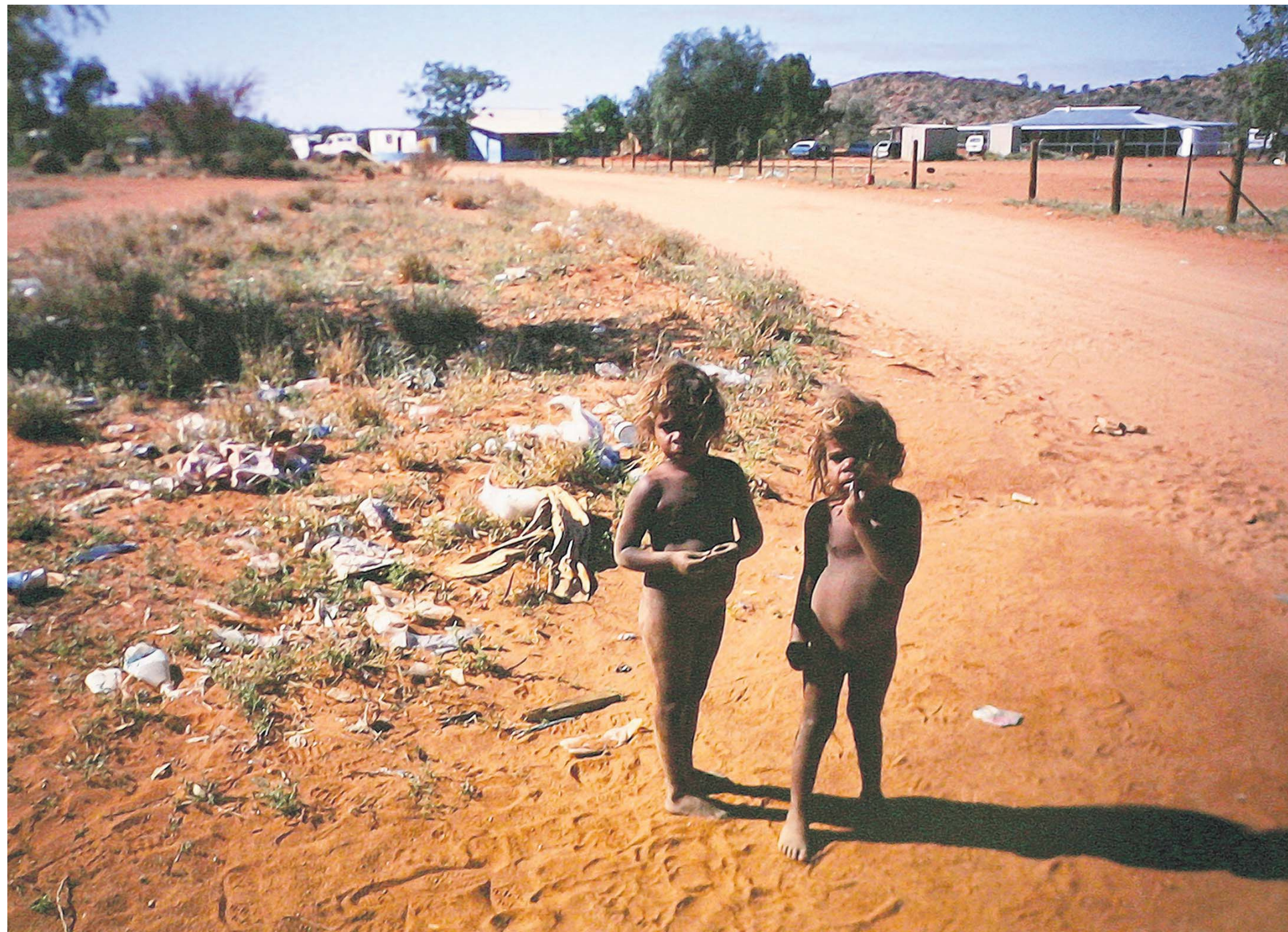
Twee Aboriginalkinderen staan bij hun nederzetting in een reservaat voor Aboriginals in Zuid-Australië. Veel van de Aboriginalnederzettingen ogen verwaarloosd en troosteloos.

De nederzettingen zijn schijnbaar achteloos neergepoot in een desolaat en fascinerend niemandsland. Een eindeloze dorre, rode vlakte met af en toe een oase van schoonheid die naar adem doet happen. Maar voor de Aboriginals - die in Australië tegen-